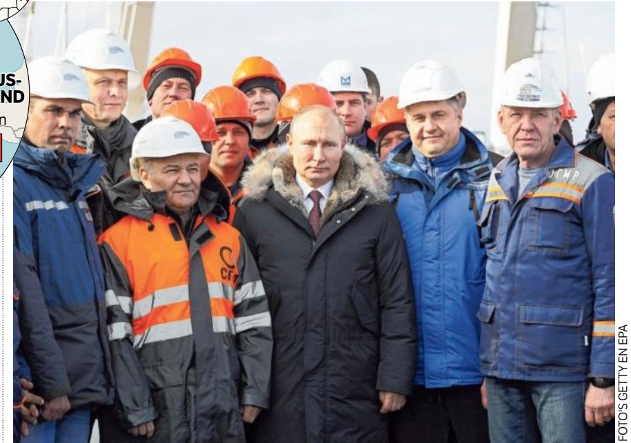
De Russische president Poetin (zonder bouwhelm) bezoekt de Krimbrug in maart dit jaar, twee maanden voor de officiële opening. De brug is bijna 19 kilometer lang.